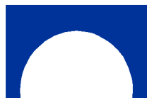
Fundación Luis Vives