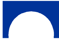
Fundación Luis Vives