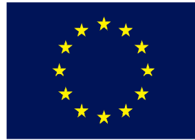
UNIÓN EUROPEA Fondo Social Europeo